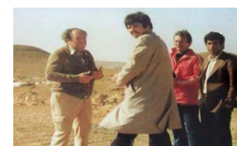
1979 -Agguerabi -Projets en Libye