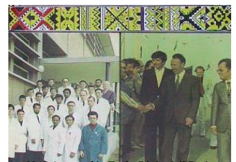
1968-Aggerabi -Ecole Génie civil Paris 1975-Avec Mr. le Président Boumediene