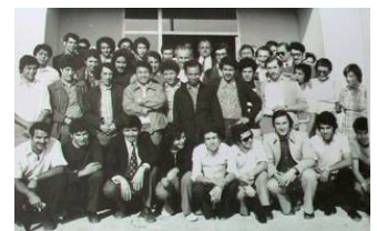
Equipe Agguerabi en 1974 à la C.O.A