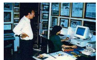
Bureau Agguerabi à Alger en 1994