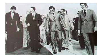
1975 - Félicitations de Boumediene à Agguerabi