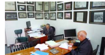
Bureau Agguerabi à Alger en 2010